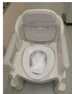
写真2 ポータブルトイレの使用例