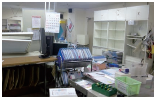
写真1 7階(A)病棟ナースステーション

手段がないために出勤できなくなったスタッフもいました。電話での連絡が不確実な中、出勤したスタッフを中心に翌日の勤務を組むという状況でした。日勤は休日体制レベルの最小限9人とし、夜間は震災当日からA棟B棟3名ずつの二交替夜勤に変更し、夜間の余震等に備え体制を整えるように配慮しました。限られた人数で対応するために、検温の回数を減らし、最小限の観察とところのケアを中心に看護にあたるよう努めました。混乱の中でも安全に業務を行ない、非常事態の中で二次的な事故が起きないことを考慮して、倒れた棚を片付け備品の再配置を行ないました。(写真3・4・5)