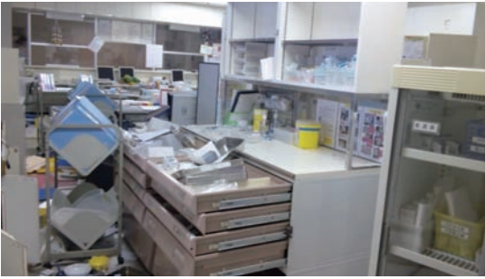
写真3 7階(B)病棟ナースステーション