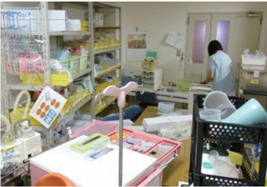
写真5 7階(B)病棟作業室

ーションから災害時はどのように対応していくか意見を出し合い検討していきました。幸いSPDに迅速に対応していただき、物品不足で苦慮することはありませんでした。