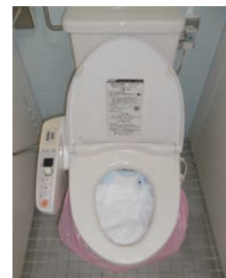
写真3 水洗トイレでの使用例