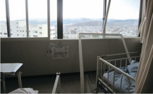
写真4 7階病棟南側4床室