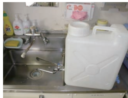
写真1 手洗用ポリタンクの設置

今回は、「手が洗えない」という感染対策の基本となるところから問題が発生しました。しかし、結果的には特に問題となるような感染症の発生はありませんでした。それは、多くの制限を強いられる中、職員の皆様が日ごろから培っている衛生観念に基づいて判断し、最善な行動ができた結果だと思えます。感染管理を担当する者として、緊急時にあっても、当然のこととして感染対策の行動がとれる職員の皆様を誇りに思います。