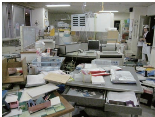
写真2 8階病棟ナースステーション