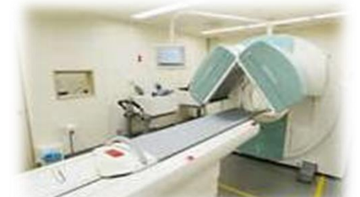
最新のMRI診断装置と、最新鋭のRI診断装置も設備されています。